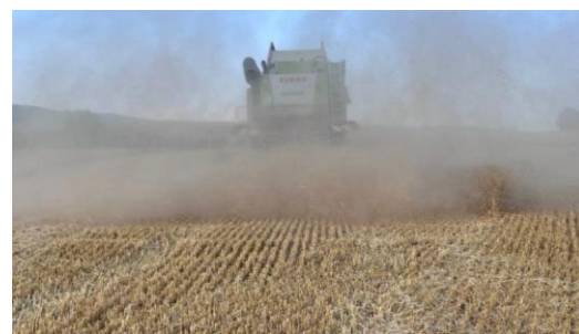
Abb. 1: Strohverteilung vom Mähdrusch

Da meist Getreide als Vorfrucht zur Zwischenfrucht steht, wird bereits bei der Ernte der Grundstein zur Etablierung einer guten Zwischenfrucht gelegt. Beim Mähdrusch muss auf die Druschverluste geachtet werden. Bei erhöhten Rotor- und Siebverlusten stellt das Ausfallgetreide eine Konkurrenz zur Zwischenfrucht dar. Zusätzlich sollte auf die Spreu- und die Strohverteilung geachtet werden, denn gerade bei großen Schneidwerksbreiten kann die Strohverteilung im Tagesverlauf variieren. Ist das Stroh vormittags oder am Abend leicht klamm, leidet die Strohverteilung meist deutlich. Des Weiteren ist während der Ernte auch auf scharfe Häckselmesser zu achten. Eine Investition in gehärtete Häckselmesser ist hier insbesondere zu empfehlen. Die Anschaffungskosten liegen zwar deutlich über den Kosten der Standardmesser, garantieren allerdings eine bis zu fünffach höhere Standzeit. Zudem reduzieren die scharfen Messer den Dieserverbrauch erheblich im Vergleich zu stumpfen Messern und auch das Häckselgut wird besser in den Stoppel „gedrückt“ und liegt nicht oben auf. Bei vorhandener Feuchtigkeit kann eine schnellere Strohorotte stattfinden und eine Etablierung der Zwischenfrucht wird erleichtert.