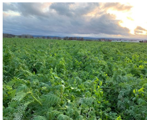
Abb. 2: Zwischenfruchtmischung TerraLife® N-Fixx

Vor der Ernte sollte sich frühzeitig mit der Auswahl einer passenden Zwischenfruchtmischung beschäftigt werden. Bei der Auswahl der richtigen Zwischenfruchtkomponenten muss u.a. darauf geachtet werden, dass die Zwischenfrucht keine artspezifischen Fruchtfolgekrankheiten fördert, wie beispielsweise Gelbsenf in Rapsfruchtfolgen. Grundsätzlich gilt dabei, dass die negativen Effekte einzelner Arten wesentlich geringer bis nicht vorhanden sind, wenn diese in einer Mischung aus mehreren Pflanzenfamilien stehen. Dies bezieht sich nicht nur auf mögliche Fruchtfolgekrankheiten, sondern auch auf die Durchwurzelung und Lockerungsfähigkeit zur Förderung der allgemeinen Bodenfruchtbarkeit. Ziel ist es, nach dem Anbau ein lockeres Krümelgefüge zu erlangen, welches für die Folgekultur ein optimales Saatbett bereitstellt und die Durchwurzelung positiv beeinflusst. Die Mischungen, die von allen führenden Saatgutherstellern angeboten werden, bieten somit für jede Fruchtfolge eine geeignete Auswahl.