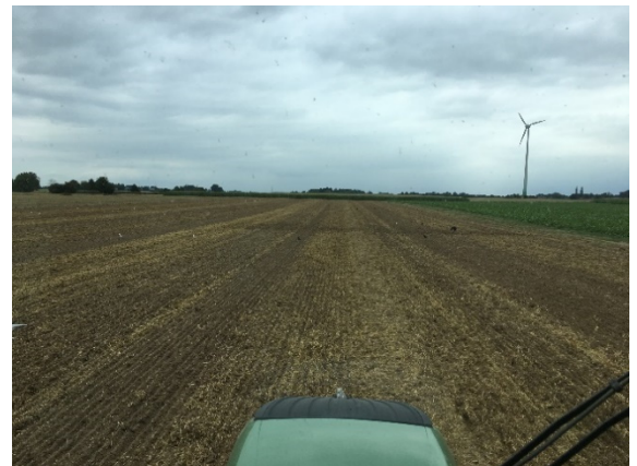
So sollte es nicht aussehen!

Mährdrusch der Vorfrucht – Da meist Getreide als Vorfrucht zur Zwischenfrucht steht, sind hier bereits die ersten „Weichen“ zu stellen. Beim Drusch sollten durch fachkundige Personen die Druschverluste, welche viel Geld kosten und bei groben Fehlern außerdem eine erhebliche Konkurrenz zur Zwischenfrucht darstellen, die Spreuverteiler und die Strohverteilung überprüft werden. Gerade bei großen Schnittbreiten > 9 m kann die Strohverteilung im Tagesverlauf verschiedene Qualitäten haben. Ist das Stroh morgens oder am frühen Abend leicht klamm, leidet die Strohverteilung meist deutlich. Auch die Fahrweise hat einen erheblichen Einfluss auf die Qualität der Strohverteilung. Ein vorzeitiges „Rumziehen“ des Dreschers am Vorgewende ist weder aus zeitlicher noch aus betriebswirtschaftlicher oder gar pflanzenbaulicher Sicht sinnvoll und sollte der Vergangenheit angehören.