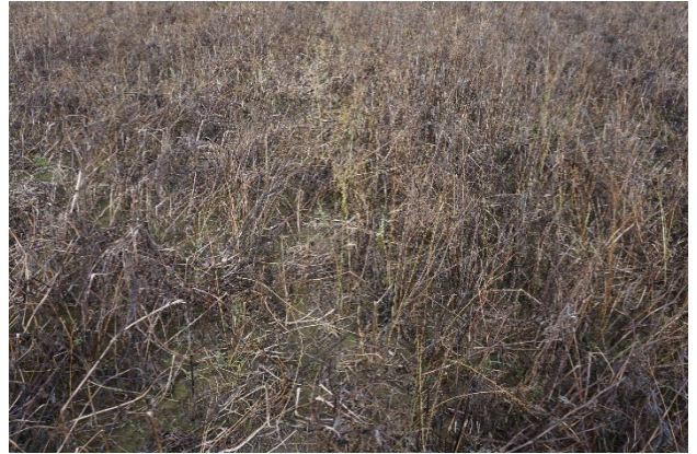
Abgefrorener Zwischenfruchtbestand 2019-2020

Ist eine sofortige Aussaat nach der Ernte nicht möglich oder sollen organische Dünger eingearbeitet werden, empfiehlt es sich trotzdem, die Bodenbearbeitung und die Aussaat kurz aufeinander folgen zu lassen. Auf eine vorzeitige Stoppelbearbeitung sollte verzichtet werden. Eine einmalige flache bis mitteltiefe (5 bis 15 cm) Bodenbearbeitung ist bei unverdichteten Böden ausreichend. Gerade im letzten Jahr hat sich gezeigt, dass die extreme Erhitzung unbedeckter, bearbeiteter Böden durch vorzeitigen Stoppelsturz einen großen Schaden am Bodenleben anrichtet. Weniger ist dann oft mehr. Eventuelle negative Effekte der organischen Dünger auf die Keimung der Zwischenfrucht sind von untergeordneter Bedeutung. Sind starke Verdichtungen bekannt oder werden solche durch eine Spatendiagnose ermittelt, empfiehlt sich eine tiefere Lockerung vor Aussaat der Zwischenfrucht. Die entstandenen Bodenrisse können dann durch die Zwischenfruchtwurzeln optimal stabilisiert werden. Diese Lockerung muss nicht zwingend mischend sein, sondern kann durchaus mit rein lockernenden Geräten (Paraplow, Agrisem, etc.) durchgeführt werden. Hier ist jedoch eine große Bandbreite an Geräten möglich und eine generelle Empfehlung schwierig. Wird tiefer und ganzflächig gelockert, sollte quer zur normalen Fahrtrichtung geackert werden, um Verdichtungen zu durchschneiden und zu lockern.